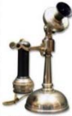
1890's - candle-stick phone