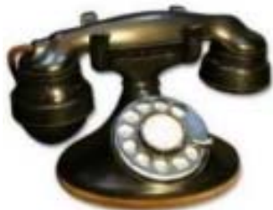
1920's - Desktop rotary dial phone