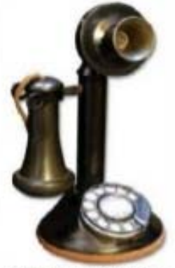
1914 - Candle-stick rotary dial phone