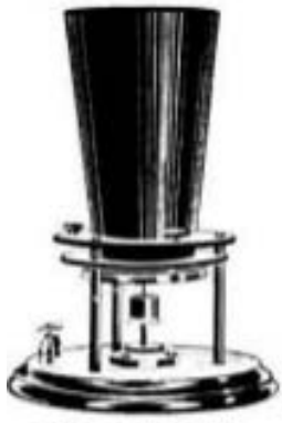
1876 - Bell's original phone

Réaliser un diaporama sur l'évolution des téléphones