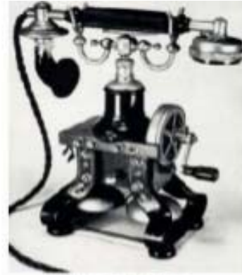
1880's - cradle phone