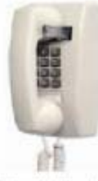
1970's - Wall touch tone pad phone