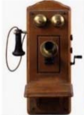
1880's - Hand crank wall phone