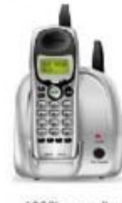
1980's - cordless phone