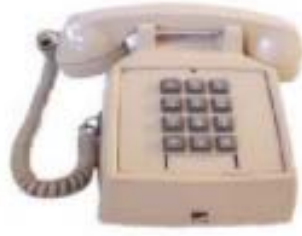
1960's - Touch tone pad phone